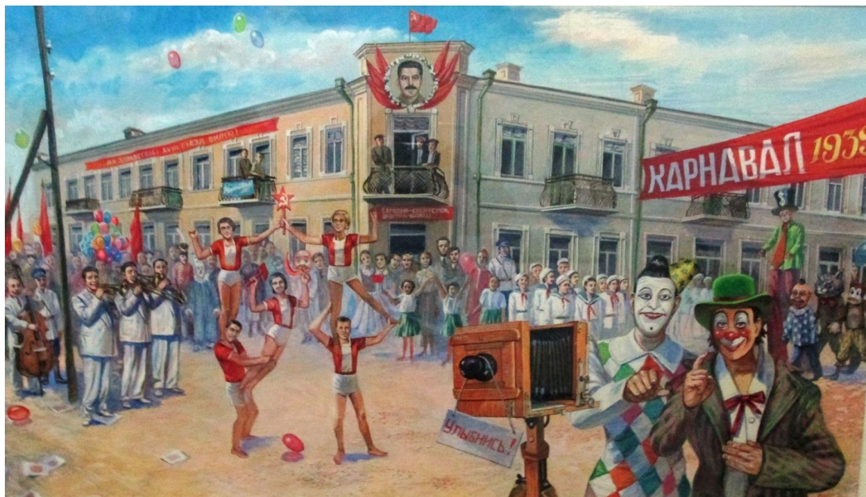
«Карнавал – 1939», худ. А. Завалий

За инициативу, проявленную при подготовке и проведению карнавала были премированы его организаторы: Барковский, Швачко, Шиц. Лучшими маскарадными костюмами стали костюмы «Весна», «Китайский боец» и «За Сталинский урожай». Необычными для наших современников были не только костюмы, их названия, но и призы: музыкальные инструменты, отрезки на платье и даже живой козленок.