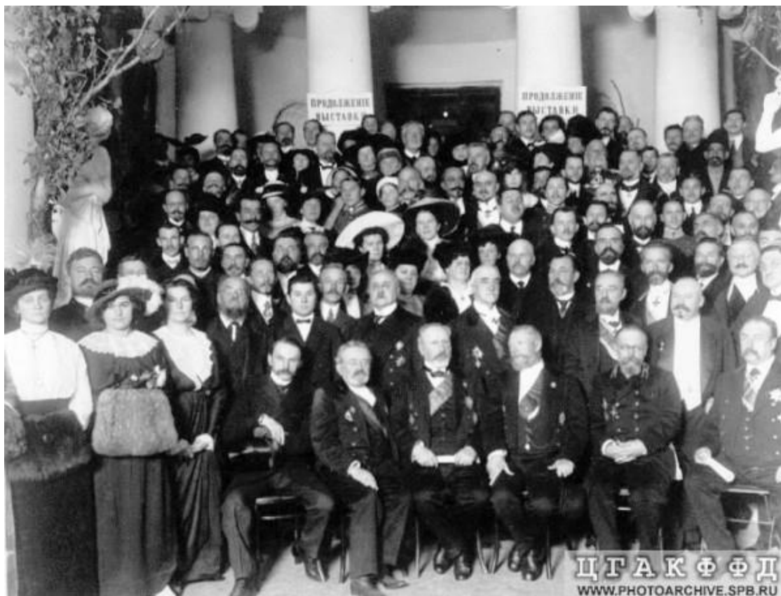
Организаторы и участники выставки «Русская Ривьера».