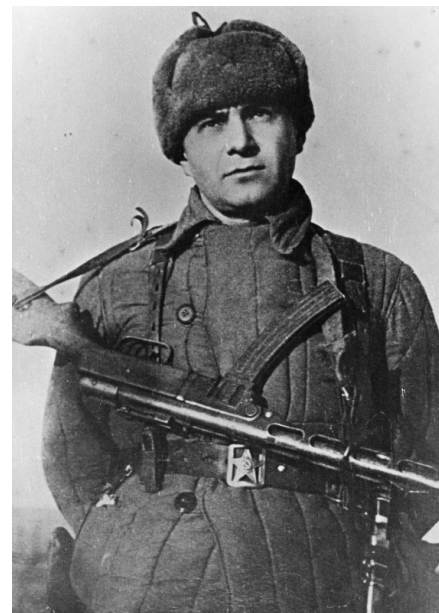
Ц.Л. Куников, офицер, командир десантного отряда, захватившего плацдарм «Малая земля» (Новороссийск)

Проект решает проблему сбора и поиска информации о местах исторических событий, а также создания системы для производства и распространения роликов в первую очередь для пользователей сети Интернет в русскоязычном сегменте силами школьников и добровольцев.