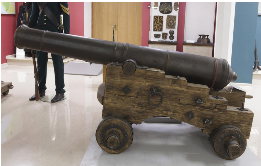
6-фунтовая артиллерийская пушка образца 1811 г.

К середине сентября 1831 года для оснащения строящегося укрепления были переданы с кораблей пушки с боеприпасами – всего 22 орудия.