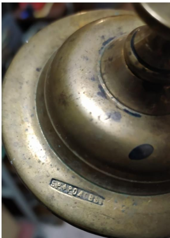
Клеймо «Бр.Фроловы» на подсвечнике