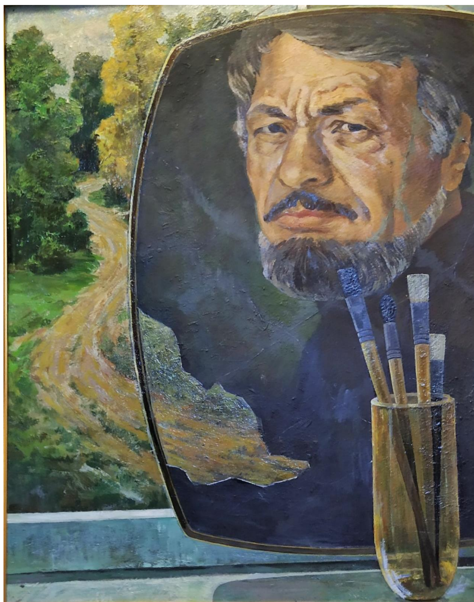
Автопортрет. Картон, масло. 1996.

Общее количество произведений живописи В.Ф. Черепехина в нашем музее составляет тридцать шесть работ. Часть из них была подарена музеем художником.