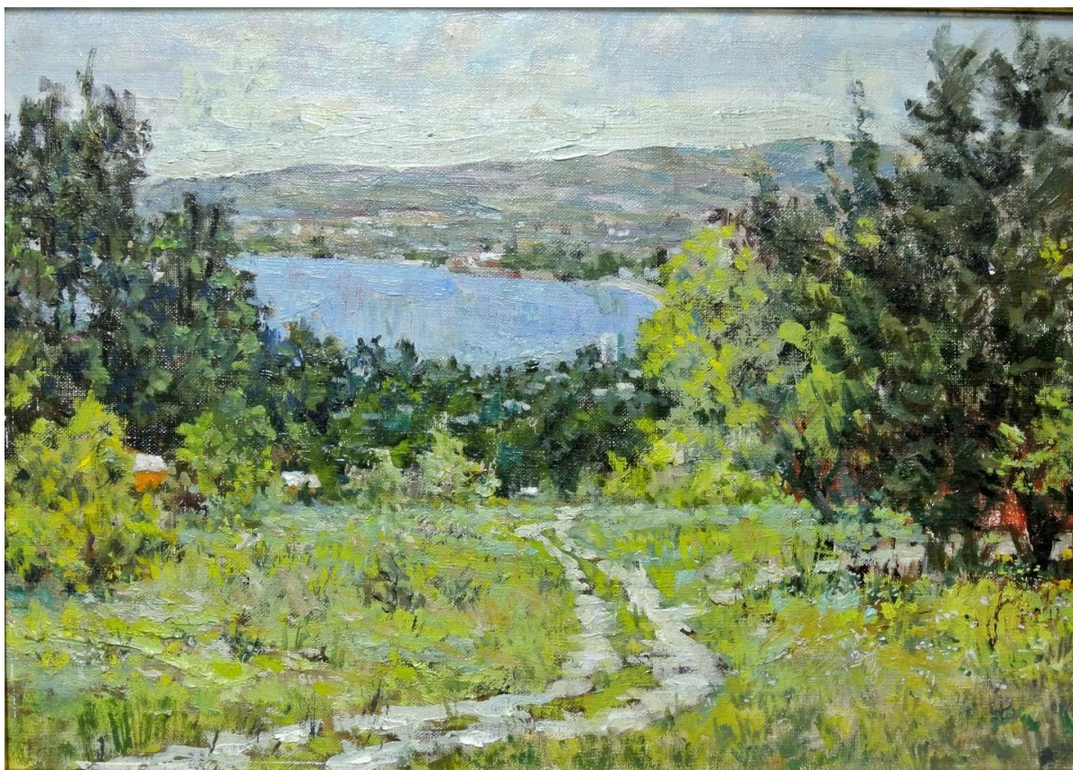
Вид на бухту из дендропарка. Холст, масло. 2001.

Главное место в его творчестве занимает пейзаж, основанный на реальных впечатлениях природы. Он любил писать с натуры, поэтому улавливал близкие его сердцу мгновения, наиболее полно выражающие его чувства. Забайкалье и Западная Украина, Центральная Россия и Греция на его полотнах выглядят также убедительно, как и природа Геленджика, которая стала для него родной и любимой.