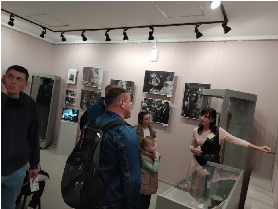
Экскурсия по выставке

Георгий Францевич Милляр считал, что одна из задач искусства – борьба с предрассудками, и в сказке есть лишь доля волшебства, а все остальное в ней настоящая жизнь. Музейные сотрудники говорят, что ценнейшие фондовые экспонаты наглядно воссоздают историю, при узнавании которой возникает букет чувств – уважения, сопричастности и благодарности.