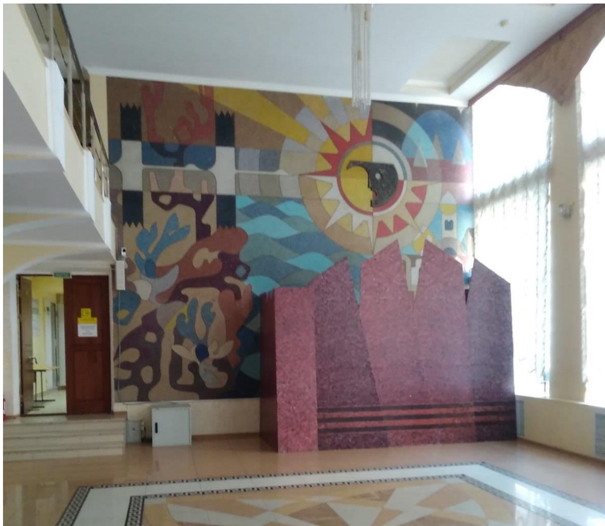
Мозаика в фойе Дворца культуры им. Л. Плешкова

В Геленджике мозаичное искусство, как один из вариантов оформления общественного пространства, получает распространение в 1970-е – 1980-е годы. К сожалению, на сегодняшний день на территории муниципального образования сохранилось крайне мало образцов советской мозаики.