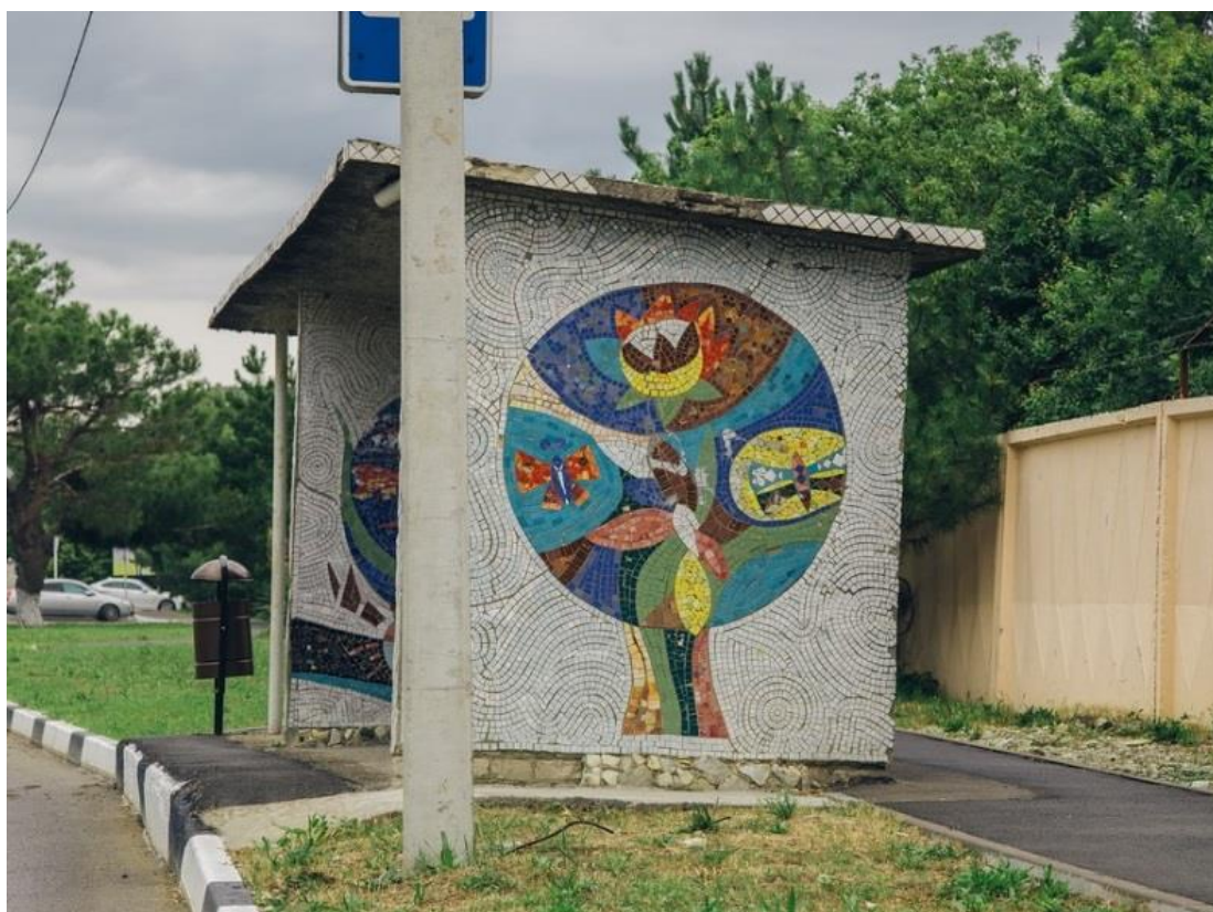
Остановка «ДПС». Геленджик, Тонкий мыс

На Тонком мысе автобусная остановка «ДПС» украшена мозаикой, выполненной из кусочков керамической плитки. Вероятнее всего остановка появилась здесь в одно время с домом отдыха «Автомобилист» в 1980-х гг.