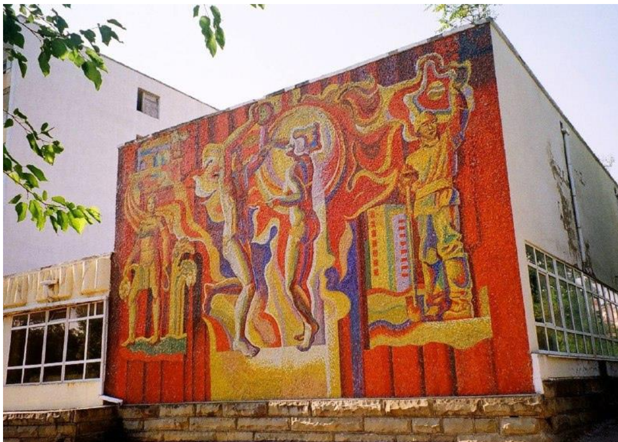
Мозаика на стене пансионата «Строитель»

мозаичное панно. В сюжете этой мозаики – тема сказки и искусства. В верхней её части – солнце, в которое «вписана» театральная маска. Такой подбор сюжета характерен для 70-х годов прошлого века, в нём отображена деятельность культурного учреждения. Также эта мозаика примечательна тем, что выполнена в технике «Мозаичная штукатурка», для её изготовления используется мелко дробленая смальта. Таким образом, мозаика во Дворце культуры является отличным примером, характерного для 1970-х гг. стремления к творческим экспериментам советских художников-монументалистов.