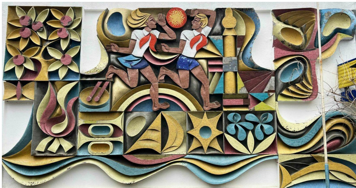
Мозаика в лагере «Альбатрос»

В с. Кабардинка сохранилось, созданное в 1974 году, объемное мозаичное панно «Детство» в детском лагере «Альбатрос». Автор работы – Анатолий Поддубский. Мозаика выполнена из кусочков керамической плитки. В центре панно – пионеры – мальчик и девочка, их окружают цветы, горы, над головами детей солнце. По материалу, объему и сюжету работа является прекрасным образцом советского монументализма 1970-х гг.