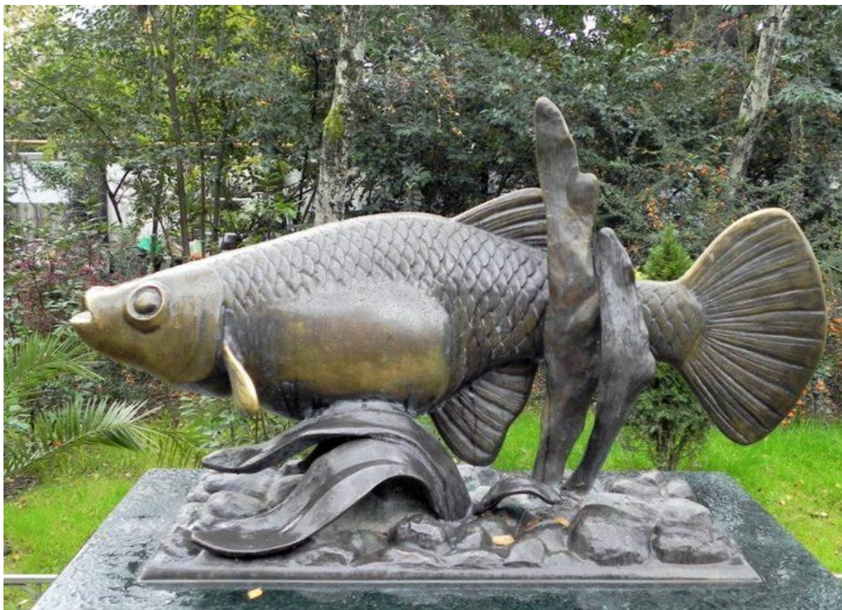
Памятник гамбузии в Сочи