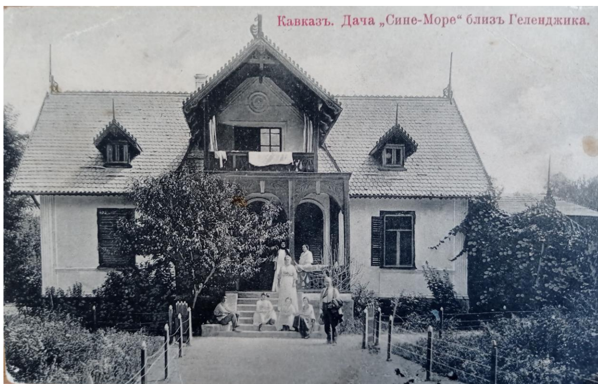
Санатория «Сине море» доктора Светлинского в с. Фальшивый Геленджик

– Недорого, очень недорого, – удивился я, – даже очень задешево можно получить лихорадку!» [10].