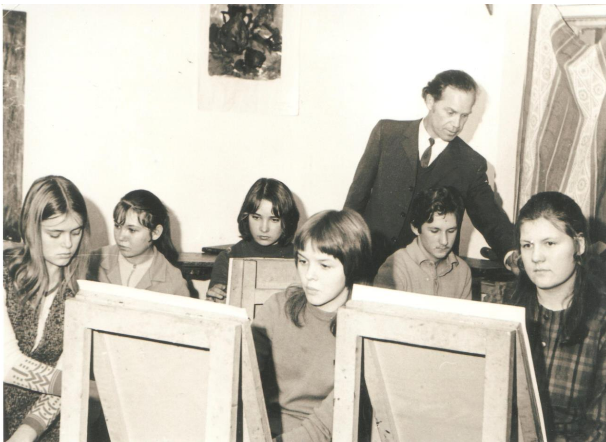
На уроке рисования