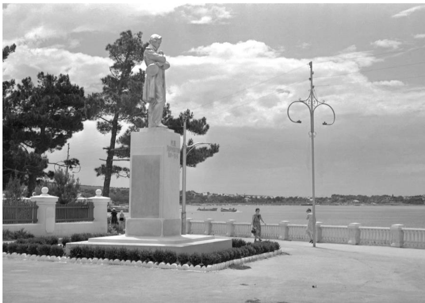
Памятник М. Ю. Лермонтову, Геленджик, 1960-е гг.