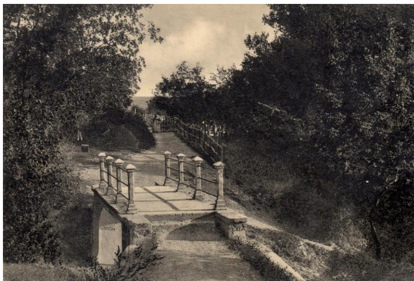
Лермонтовский мостик, место встречи влюбленных нескольких поколений. Геленджик, нач. XX в.

15 октября (по новому стилю) 2024 г. наша страна отмечает 210-летнюю годовщину со дня рождения великого русского поэта, певца Кавказа Михаила Юрьевича Лермонтова. Это имя бесконечно дорого нам, геленджичанам. Замечательный памятник поэту в центре города на набережной, знаменитый Лермонтовский бульвар, Лермонтовский мостик (утраченный в 1960-е гг.) тому подтверждение.