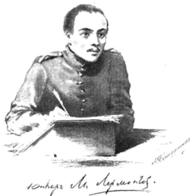
Юнкер М. Лермонтов.

Стихотворение «Смерть поэта» явило российской публике Лермонтова во всей силе его поэтического таланта.