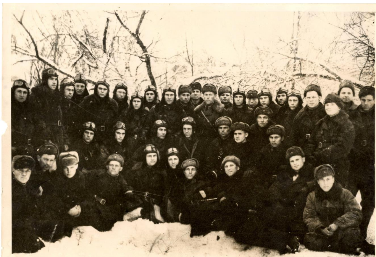
Личный состав 2 эскадрильи 889 ордена Кутузова III степени Новороссийского легко-бомбардировочного авиаполка.

В период героической битвы за Кавказ 889-й авиаполк произвел 1210 боевых и 1343 оперативно-боевых вылетов с общим налетом 2340 часов. Летный состав, выполняя боевые задания, сбросил на врага около 120 тонн бомб разного калибра, расстрелял по вражеским зенитным батареям и прожекторам 50 реактивных снарядов (РС-82), разбросал в тылу вражеских войск 425 тысяч листовок. В боях за Новороссийск 889-й авиаполк на ночных легких бомбардировщиках ПО-2 и ночных истребителях И-153 «Чайка» осуществили 705 боевых и 150 оперативно-боевых полетов с общим налетом 860 часов. Экипажи полка сбросили на врага более 70 тон бомб разного калибра, расстреляли около трех десятков реактивных снарядов РС-82, разбросали в тылу вражеских войск 50 тысяч листовок. 6-го сентября 1943 года для участия в операции советских войск по освобождению Новороссийска 889-й авиаполк перебазировался на аэродром Геленджик (Солнцедар), полку были приданы восемь экипажей женского 46-го гвардейского авиаполка.