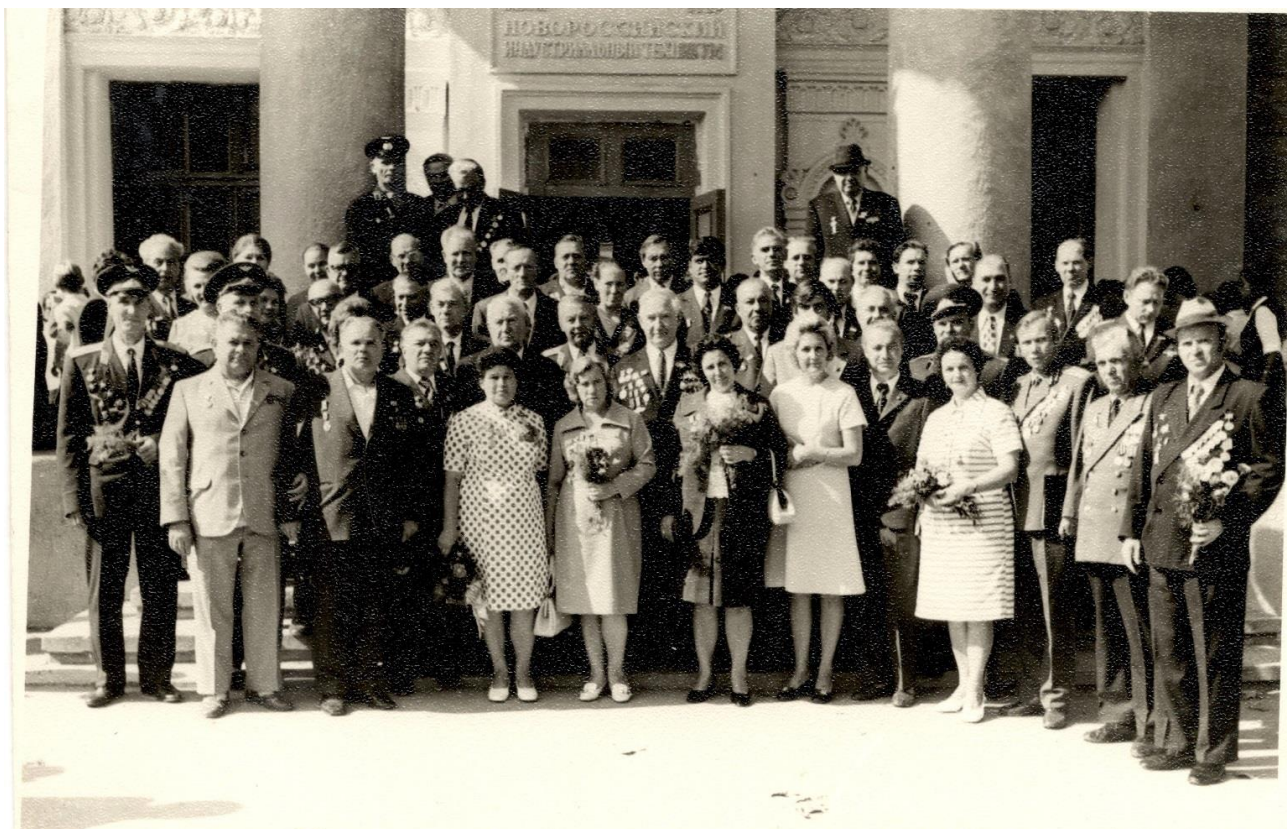
Группа ветеранов 889-го Новороссийского авиаполка. Сентябрь, 1975

30-го сентября 1945 года решением Ставки Верховного Главнокомандующего 889-й авиаполк был расформирован. За весь период участия полка в боях Советской Армии на фронтах с 14.11.1941 по 5.05.1945 полк произвел 20260 боевых, 12900 оперативно-боевых вылетов. В боях с немецко-фашистскими захватчиками полк потерял 28 человек – летчиков, штурманов, техников. Личный состав получил более 800 правительственных наград. Очередная встреча ветеранов 889-го Новороссийского авиаполка состоялась в сентябре 1975 в городе-герое Новороссийске в индустриальном техникуме, посвященной 32-й годовщине разгрома немецко-фашистских войск.