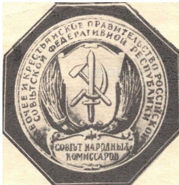
Эскиз герба Е.И. Камзолкина

В газете «Советская Кубань» от 9 апреля 1982 года в заметке корреспондента ТАСС А.Сивцова читаем: «На красном фоне в лучах восходящего солнца он изобразил скрещенные серп, молот, меч. В воспоминаниях управляющего делами Совнаркома В.Бонч-Бруевича, Ленин, внимательно рассмотрев проект герба, сказал: «Завоевательная политика нам совершенно чужда» и зачеркнул меч».