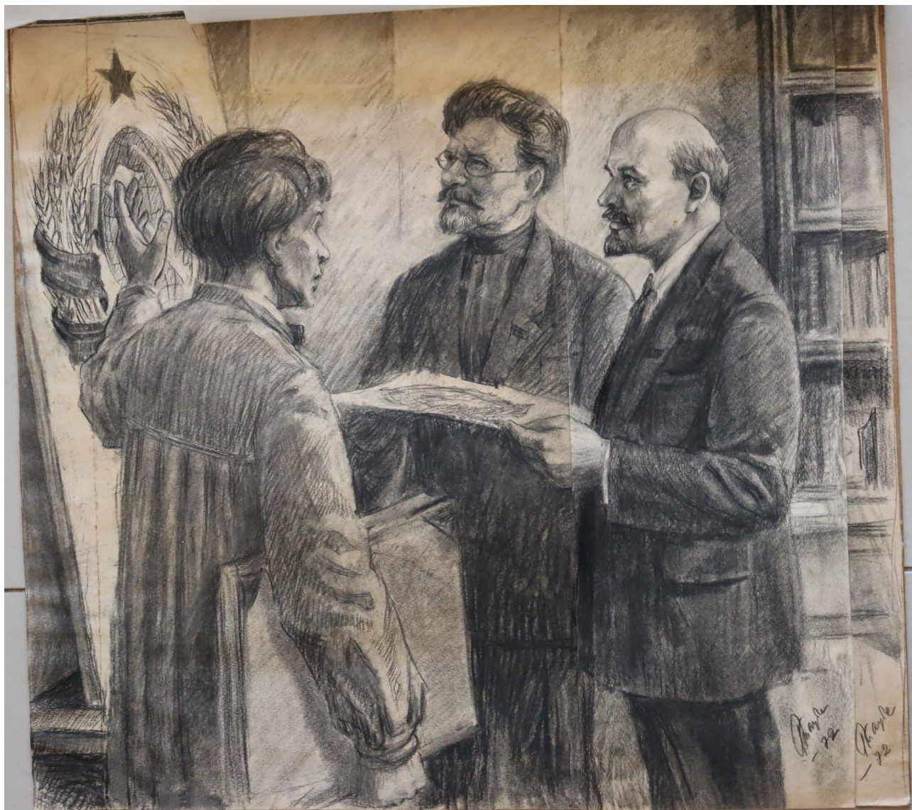
Художник Георгий Таубе «В.И. Ленин, М.И. Калинин обсуждают эскиз герба СССР, предложенный художником»

В 1973 году Геленджикским историко-краеведческим музеем приобретен карандашно-угольный рисунок новороссийского художника Георгия Сергеевича Таубе (1915-1979 гг.). Название – «В.И. Ленин, М.И. Калинин обсуждают эскиз герба СССР, предложенный художником» – показывает значительное событие – создание нового герба.